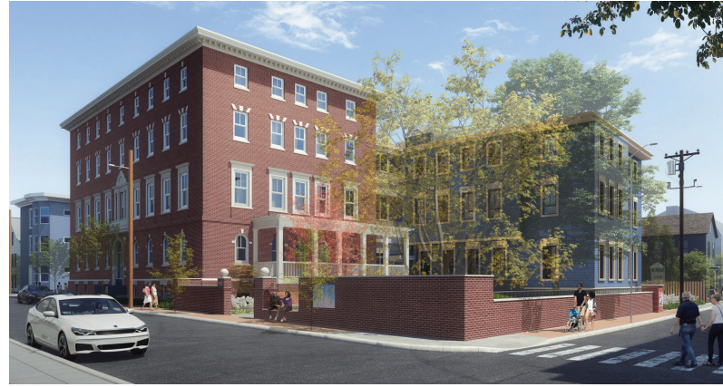
شارع ١١٦ Norfolk الإنشاء قيد التنفيذ في ٦٢ وحدة من الوحدات السكنية منخفضة الإيجار مع توفير خدمات دعم بالموقع للسكان ذوي الدخل المنخفض.

التكامل هو محور أساسي تركز عليه كامبريدج، وتعمل المدينة عن كثب مع ملاك المباني والمديرين لتعزيز تجارب سكان الإسكان الاقتصادي. ستعمل التوصيات الصادرة عن الدراسة متعددة السنوات لـ "تجارب المقيمين من الدمج والتحيز لصالح الإسكان الشامل على توجيه إجراءات المدينة لإنشاء مجتمعات أقوى وأكثر تماسكاً. وفي العام المالي المنصرم، تم الانتهاء مما يربو على ١٠٠ وحدة من الوحدات السكنية المؤجرة الاقتصادية وتمت مراجعة ما يربو على ١٠٠ وحدة سكنية اقتصادية جديدة.