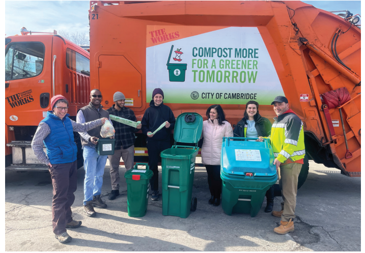
وفي مارس، احتفلت المدينة بمرور ٥ سنوات من "سماد البقايا". ومنذ عام ٢٠١٨، حوّل سكان كامبريدج أكثر من ٦٥٠٠ طن من نفايات الطعام من القمامة إلى سماد.

تدرك كامبريدج الحاجة الملحة لتكثيف بنيتها التحتية لتحمل آثار تغير المناخ. وتعتبر الاستثمارات الضخمة في البنية التحتية المقاومة للفيضانات، مثل أنظمة الاحتفاظ بمياه الأمطار وحدائق الأمطار، أمرًا ضروريًا للتخفيف من الفيضانات المحلية وحماية جودة المياه. ومن خلال دمج البنية التحتية الخضراء في مشاريع إعادة إعمار الشوارع والأماكن العامة، تعمل المدينة على زيادة الفوائد المشتركة للتخفيف من حدة الفيضانات وترشيح المياه، مما يساهم في بيئة حضرية أكثر استدامة ومرونة.