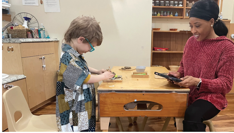
معلم وطالب يتشاركان نشاط استكشافي تحت إشراف مدرب مكتب كامبريدج للطفولة المبكرة (OEC).

تتخذ مدينة كامبريدج خطوات مهمة لتحسين التعليم في مرحلة الطفولة المبكرة والرعاية بعد المدرسة. يقود "مكتب كامبريدج للطفولة المبكرة" (OEC) الجهود المبذولة لتطوير مرحلة التعليم قبل المدرسي الشامل (UPK) من خلال برنامج كامبريدج لمرحلة ما قبل المدرسة، الذي سيوفر يوم دراسي مجاني، سنة دراسية لمرحلة ما قبل المدرسة لجميع الأطفال الذين يبلغ أعمارهم ٤ سنوات في كامبردج وبعض الأطفال الذين تتراوح أعمارهم بين ٣ سنوات من ذوي الاحتياجات الخاصة.