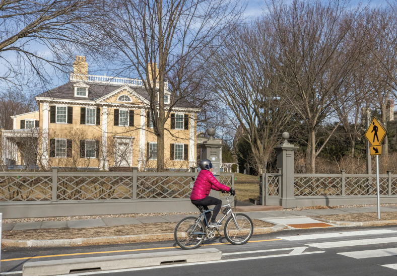
ممر دراجات Brattle Street.

إزالة الكثير من الجزء الأوسط، وإضافة ممرات الدراجات المنفصلة سريعة البناء، وإجراء تحسينات من أجل لأشخاص الذين يمشون وإعادة تكوين الشارع لتعزيز السلامة وإمكانية الوصول. يمثل هذا المشروع أكبر استثمار في البنية