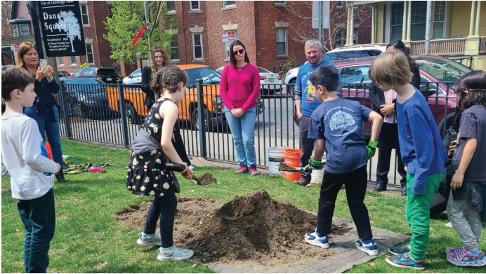
تعتبر الغابة الصحية جزءًا أساسيًا من المدينة الصحية. ونحن جميعًا نتقاسم مسؤولية رعاية غابتنا الحضرية.

ومع استمرار كامبريدج في تنفيذ مبادرات الاستدامة الخاصة بها، فإنها تعمل كنموذج للمدن الأخرى، مما يدل على أن اتخاذ إجراءات بشأن تغير المناخ أمر ضروري وقابل للتحقيق. ومع استمرار التفاني والتعاون، تمهد كامبريدج الطريق نحو مستقبل أكثر خضرة وأكثر مرونة واستدامة للجميع.