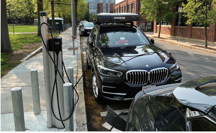
محطة شحن السيارات التي تعمل بالكهرباء في ٢٩ Tudor Street.

وبالإضافة إلى ذلك، تبنت كامبريدج مفهوم غابات ميواكي المصغرة. وبالتعاون مع "التنوع البيولوجي من أجل مناخ صالح للعيش" Biodiversity for a Livable Climate، أنشأت المدينة غابة ميواكي المصغرة الثانية في Greene-Rose Park. وتساهم هذه الغابات المصغرة في التخفيف من حدة الجزر الحرارية الحضرية، ودعم التنوع البيولوجي، ومكافحة الفيضانات والتآكل، وعزل الكربون. ومن خلال دمج الطبيعة في المشهد الحضري، تعمل كامبريدج بنشاط نحو إنشاء بيئة أكثر صحة واستدامة لسكانها.