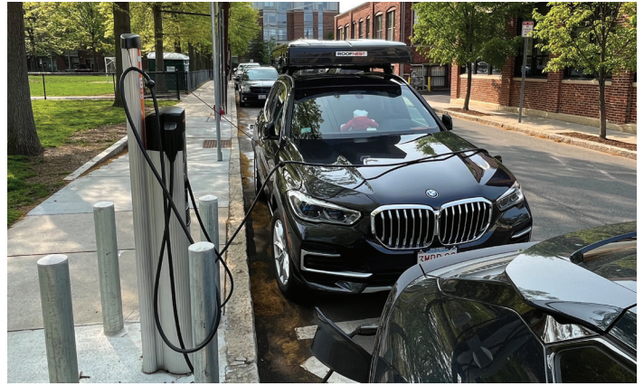
位于 29 Tudor Street 的电动车充电桩。

Cambridge 承诺，通过城市森林主计划 (UFMP) 保存并扩张城市森林。市政府将要在 FY24 拨款 410 万美元，以进一步增强树木资产，并宣传城市森林的诸多益处。