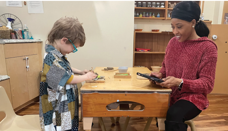
老师与学生在 OEC 教练的指导下参加探索活动。

City of Cambridge 正在实施重要的行动，改善早期儿童教育与课后照看。Cambridge Office of Early Childhood (OEC) 率先展开行动，通过 Cambridge Preschool Program 发展普惠学前教育 (UPK)，向 Cambridge 的所有 4 岁儿童以及一些有特定需求的 3 岁儿童提供免费的全日制、全学年制学前教育。Cambridge Preschool Program 将帮助家庭查找跟学前选项有关的信息，使