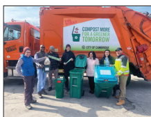
Cambridge 可持续性举措 第 4-5 页