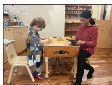
增加参与优质学前与课后项目的机会 第 6 页