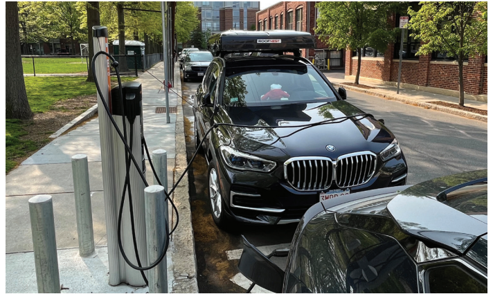
Estasyon pou Chaje Machin Elektrik ki nan 29 Tudor Street.

Nan kad UFMP, Depatman Travo Piblik Meri a te reyisi plante plis pase 1,000 pyebwa pa ane. Sou baz reyalyasyon sa a, Cambridge planifye plante 1,200 pyebwa ane pwochèn. Nouvo pyebwa sa yo pa sèlman la pou rann Vil lan bèl men pral yo pral bay sèvis ekosistèm (frechè) ki enpòtan tou.