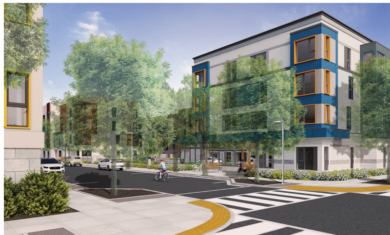
Lojman Piblik Federal Jefferson Park. Administrasyon Lojman Cambridge (Cambridge Housing Authority) dwe kòmansè renovasyon/konstriksyon 175 lojman nan pwojè devlopman sa a ki nan Nò Cambridge pou kontinye bay lojman bon mache endispansab pral rete fyab sou plan finansyè ak ekonomikman.