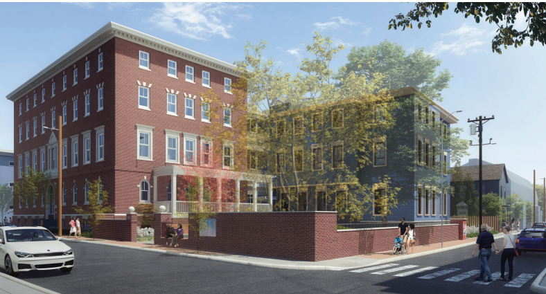
116 Norfolk Street. Y ap konstui 62 lojman sosyal pou lwe ki gen sèvis sipò sou plas pou rezidan ki gen revni fèb yo.

Cambridge ensiste sou entegrasyon epi Meri a ap travay nan tèt kole ansanm ak pwopriyete bilding ak responsab yo pou amelyore eksperyans rezidan lojman sosyal yo. Rezilta etid plizyè ane yo sou Eksperyans Rezidan yo nan kesyon Entegrasyon ak Prejije nan Lojman Sosyal yo pral gide aksyon Meri a ap pran pou kreye kominote ki plis djanm, epi ki plis soude.