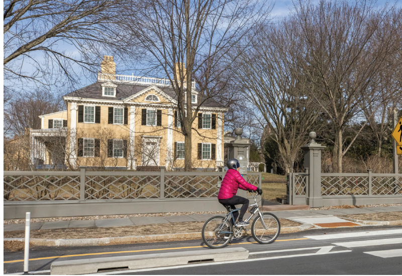
Vwa pou bisiklèt nan Brattle Street.

Pandan nouvo ane fiskal lan, investisman nan enfrastrikti nou an depase doub lan, pou li atenn $70.6 milyon. Yon pati enpòtan nan finansman sa a – 50 milyon – yo pral debloke li pou pwojè Rekonstriksyon Pasyèl Mass Ave. Pwojè enpòtan sa a gen pou objektif pou reponn ak objektif Òdonans sou Sekirite Siklis (Cycling Safety Ordinance, CSO) pou kreye vwa pou bisiklèt separe nan youn nan wout ki gen plis trafik nan vil la. Pwojè a prevwa retire anpil nan lari a, ajoute vwa rapid pou bisiklèt ki separe, fè amelyorasyon pou