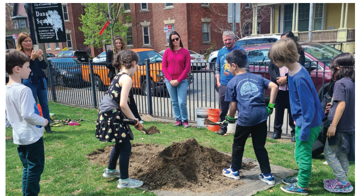
Yon forè an sante se yon eleman enpòtan pou gen yon vil ekolojik. Nou tout genyen responsabilite pou pran swen forè iben nou an.

Etdone Cambridge kontinye aplike inisyativ devlopman dirab li yo, sa sèvi antanke yon modèl pou lòt vil yo, ki demontre li enpòtan ak posib pou pran mezi pou lite kont chanjman klimatik lan. Gras ak yon devouman epi kolaborasyon pèmanan, Cambridge louvri vwa pou yon avni ekolojik, plis rezistan ak dirab pou tout moun.