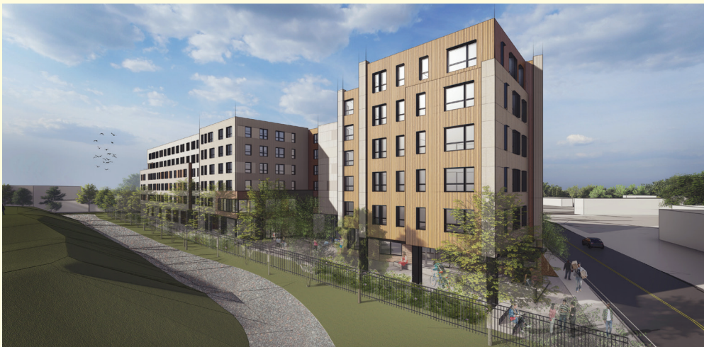
52 New Street. Yo espere pou konstriksyon 107 lojman bon mache pou lwe yo kòmanse byento.