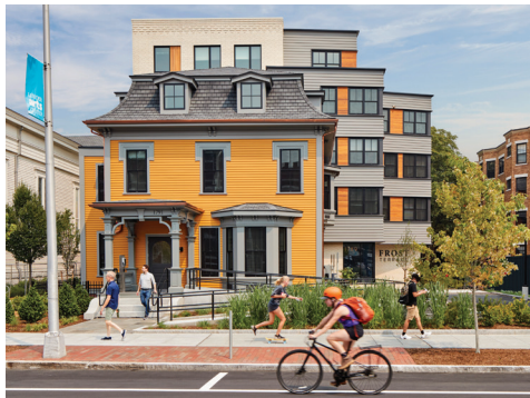
A conclusão do Frost Terrace no AF22 trouxe 40 novas unidades de habitações acessíveis para Porter Square.