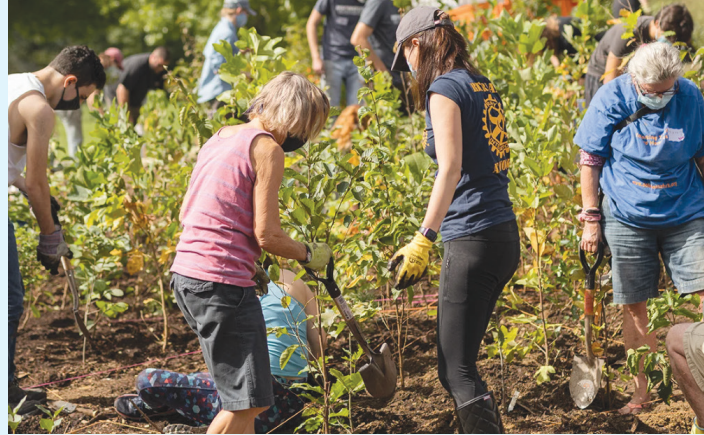
Voluntários trabalham para plantar 40 espécies nativas de plantas na Floresta Miyawaki no Danehy Park.

No ano passado, a City of Cambridge colaborou com a Biodiversity for a Livable Climate e o Projeto SUGi para estabelecer uma Miyawaki microforest de 4.000 pés quadrados no Danehy Park. Miyawaki Forests oferecem uma oportunidade para restabelecer florestas saudáveis em ambientes urbanos, mitigar o efeito da ilha de calor urbana, apoiar a biodiversidade, amortecer inundações e erosão, ajudar a equilibrar os ciclos da água para combater as condições de seca e sequestrar carbono.