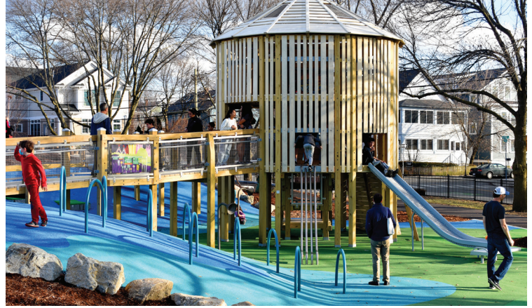
New Louis A. DePasquale Universal Design Playground em Danehy Park.

No AF22, a cidade concluiu a construção de vários projetos de parques e espaços abertos. Timothy J. Toomey, Jr. Park em East Cambridge conta com um novo playground, espaço para cães e área verde. O Louis A. DePasquale Universal Design Playground, em Danehy Park serve como um modelo de playground inclusivo projetado para que visitantes de todas as capacidades se divirtam juntos. As reformas no Glacken Field incluíram melhorias na área verde, uma pista circular no perímetro, conexões aprimoradas com as quadras existentes e um lote totalmente renovado. O Watertown-Cambridge Greenway fornece uma nova conexão de caminho