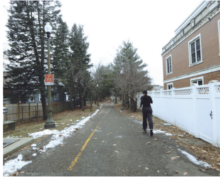
Danehy Park-এর সঙ্গে প্রস্তুত সংযোগ এটি New Street পরের পরে একটি পুনর্গঠিত, পায়ের হাঁটার উপযোগী সংযোগস্থল।

Alewife এবং North Cambridge-এ দুইটি নতুন করিডোরের ডিজাইন শুরু হচ্ছে। Danehy Connector/New Street Path, Fresh Pond-এর কাছের Concord Avenue থেকে Fitchburg যাতায়াতের রলে লাইন প্রস্তুত বাডানো হচ্ছে, এবং MBTA পথ ব্যবহারের অধিকার অনুমোদিত হলে তা Sherman Street প্রস্তুত তা বাডানো হতে পারে। এটি একটি শান বাঁধানো বহুবিধ-ব্যবহারের পথ, ল্যান্ডস্কেপিং এবং গাছ লাগানো, আলোর ব্যবস্থা করা এবং