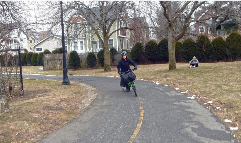
Linear Park-এর আসন্ন নকশা প্রক্রিয়া, এর ব্যবহারকারীদের আকর্ষণ করা এবং এই গুরুত্বপূর্ণ খোলা জায়গাটিকে উন্নত করার ব্যাপারে ফোকাস করবে।

অফ-রোড পথগুলি Cambridge এবং এর আশপাশে বড়োবার জন্য একটি আরামদায়ক এবং মজাদার উপায়ের ব্যবস্থা করে থাকবে। এই সুবিধাগুলি হাঁটা, দৌড়ানো, সাইকেলে চালানো, স্কটেরিং এবং যারা চাকাওয়াল গাভী যান ব্যবহার করে তাদের জন্য ডিজাইন করা হয়েছে। Cambridge-এর ক্রমবর্ধমান পথের নটেওয়ার্ক হলো শহরের খোলা জায়গা এবং পার্কের অন্তর্ভুক্ত জায়গাগুলির একটি গুরুত্বপূর্ণ অংশ।