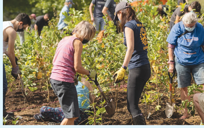
স্বচ্ছাসবেকরা Danehy Park-এর Miyawaki বনে 40টি দেশীয় প্রজাতির গাছপালা পোঁতার জন্য কাজ করে।

ব্যক্তিগত সম্পত্তিতে বিদ্যমান গাছ সংরক্ষণ করার বিষয়টা হলো UFMP সুপারিশের আরেকটি মূল দিক। FY22 সালে, Cambridge সটি কাউন্সিল বর্তমান অধ্যাদেশের