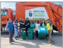
কেমব্রিজের স্থায়ী সংক্রান্ত উদ্যোগ পেজ 4-5