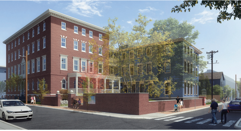
116 Norfolk Street. কম রোজগার করেন, এমন বাসিন্দাদের জন্য অন-সাইট সমর্থন পরিষেবা সহ 62টি সাপ্তাহিক রেন্টাল ইউনিটের নিমাণ চলছে।

গত ফিসক্যাল বছরে 100টিরও বেশি নতুন অন্তর্ভুক্তি রেন্টাল ইউনিট সম্পূর্ণ করা হয়েছে এবং 100টিরও বেশি নতুন অন্তর্ভুক্তিমূলক অন্তর্ভুক্তি ইউনিটের