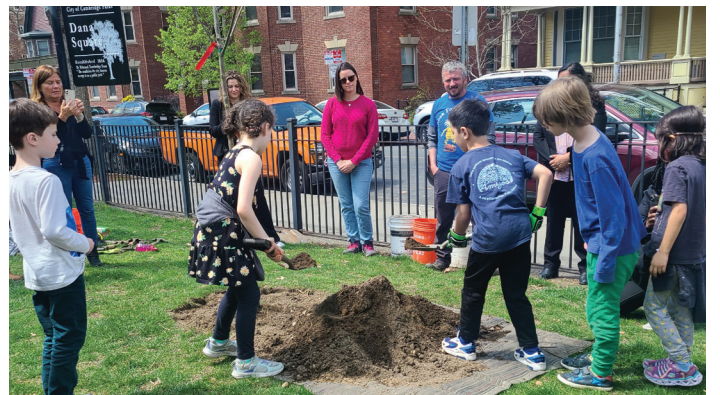
একটি স্বাস্থ্যকর শহরের গুরুত্বপূর্ণ অংশ হলো স্বাস্থ্যকর জঙ্গল। আমাদের শহরাঞ্চলের গাছপালার যত্ন নেওয়ার জন্য আমাদের সবার একটা দায়িত্ব আছে।

একদিকে কেমব্রিজ যখন নিজের স্থায়িত্ব সংক্রান্ত উদ্যোগ বাস্তবায়ন করা চালিয়ে যাচ্ছে, তখন অন্যদিকে এটি অন্য শহরগুলোর কাছে একটি মডেল হিসাবে কাজ করছে। এখান থেকে বোঝা যাচ্ছে যে জলবায়ু পরিবর্তনের ব্যাপারে পদক্ষেপ গ্রহণ করা প্রয়োজন এবং তা অর্জন করাও সম্ভব। নিরবচ্ছিন্ন আত্মোৎসর্গ এবং সহযোগিতার মাধ্যমে কেমব্রিজ সবার জন্য আরও সবুজ, আরও মজবুত এবং স্থায়ী ভবিষ্যৎ গড়ে তোলার রাস্তা তৈরি করছে।