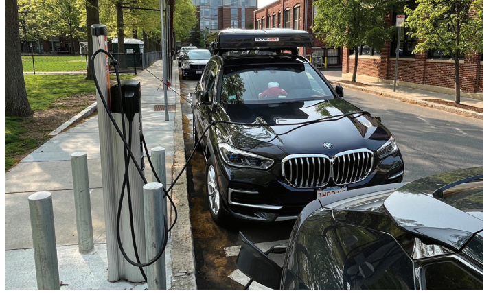
29 Tudor Street-এ ইলেক্ট্রিক ভেহিকল চার্জিং স্টেশন।

এছাড়া কেমব্রিজ Miyawaki মাইক্রোফরেস্টের উদভাবনীমূলক ধারণা গ্রহণ