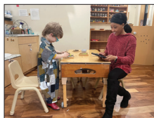
উচ্চমানের পাক স্কুল এবং স্কুলপরিষদ প্রোগ্রামে অ্যাক্সেস বৃদ্ধি করা পেজ 6