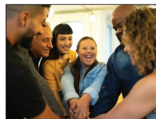
জাতিবিদ্বেষ, ন্যায়বিচার এবং অন্তর্ভুক্ত পেজ 8