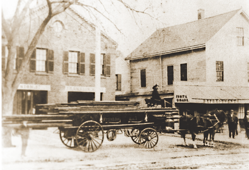
CHC. Courtesy Christian Mission Holiness Church.

Construído em 1852, foi o maior dos três quartéis de bombeiros da cidade e agora é o mais antigo quartel intacto de Cambridge. Quando um novo quartel de bombeiros foi construído na Lafayette Square em 1894, o antigo prédio passou por uma série de proprietários até ser comprado pela Christian Mission Holiness Church em 1916.