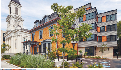
مسكن ميسور التكلفة في مشروع Frost Terrace & Inman Crossing