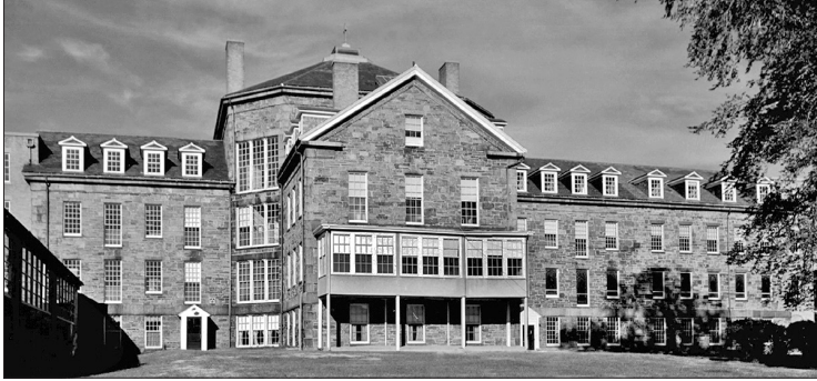
لا يزال مبنى مساكن الفقراء Almshouse قائمًا في 45 Matignon Avenue وكان مقرًا لمدرسة École Bilingue منذ عام ٢٠٠٥. Photo ca. 1969.

منذ بداية الاستيطان الإنجليزي في نيو إنجلاند خلال الحرب الثورية، لجأ الأشخاص المحتاجون إلى العائلات والجيران والكنيسة للحصول على المساعدة. وقد أصبح أي شخص يفتقر إلى الدعم مسؤولية على عاتق المدينة؛ وتم إلزام الأطفال بالعمل كمتدربين أو خدم، وتعيين البالغين كعمال. دفعت الحرب والكساد المالي المزيد من الناس إلى الفقر، وبدأت المدن في جمع الفقراء بها في دور رعاية (مسكن فقراء) في مزارع المدينة.