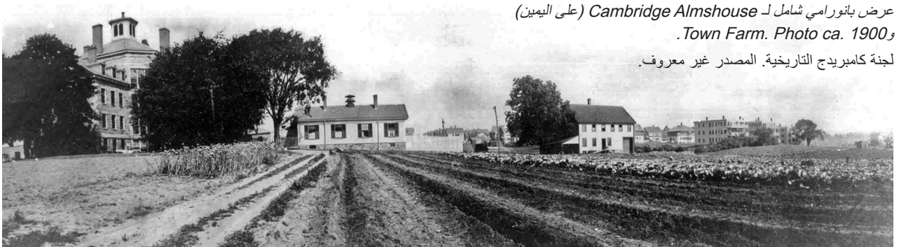
عرض بانورامي شامل لـ Cambridge Almshouse (على اليمين) و Town Farm. Photo ca. 1900. لجنة كامبريدج التاريخية. المصدر غير معروف.

كان أول منزلان في كامبريدج في مبانٍ حديثة: الأول في ميدان هارفارد Harvard Square عام ١٧٧٩، والثاني في شمال كامبريدج North Cambridge عام ١٧٨٦. أما الثالث، الذي بُني عام ١٨١٨ بالقرب من حديقة Sennott Park اليوم، فقد احترق عام ١٨٣٦. والرابع بُني على أرض اشترتها البلدية عام ١٨٣٨. كانت مساحة ١١ فدانًا الممتدة على طول نهر تشارلز Charles River من Western Avenue تقريبًا حتى شارع River Street، تتسع لملاجأ فقراء ومزرعة مدنية. وقد زادت قيمة العقار بشكل كبير، وفي عام ١٨٤٩، باعته البلدية إلى ناشر قام بتحويل ملجأ الفقراء المبني من الطوب إلى مصنع للكتب Riverside Press. أصبح بعد ذلك نواة مطبعة