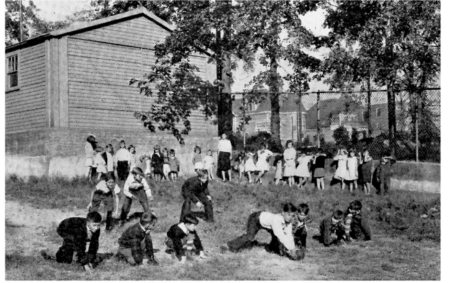
افتتحت دار Avon Home ملعباً لأطفال الحي في الفناء الخلفي الكبير لـ 1000 Mass. Ave.