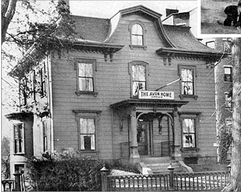
كان آخر عنوان لـ Avon Home كان ١٠٠٠ هو شارع ماساتشوستس Massachusetts Avenue. وقد تم هدم المبنى في عام ١٩٧٥.

لجنة كامبريدج التاريخية. التقرير السنوي الخامس والخمسون لدار Avon Home، لعام ١٩٢٩.