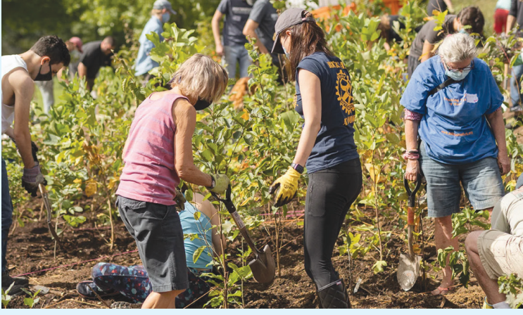
يعمل المتطوعون على زراعة 40 نوعًا أصليًا من النباتات في Miyawaki Forest في Danehy Park .

يجب الحصول على تصريح من City Arborist. ومع إعادة الزراعة كخيار للتخفيف، يتم زراعة أشجار إضافية في شتى أرجاء كامبريدج. ويقوم متخصصو الأشجار والشجيرات لدى Public Works بمراجعة خطط الزراعة واختيار الأنواع ومبالغ التخفيف النهائية وإجراء عمليات التفتيش بعد الزراعة.