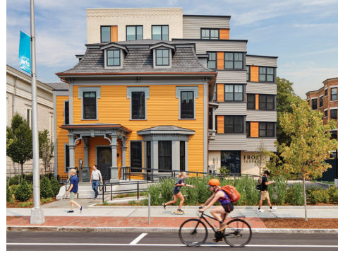
وقد جلب الانتهاء من Frost Terrace من السنة المالية ٢٠٢٢ وحدة سكنية جديدة بأسعار معقولة إلى Porter Square.

• Cambridge Jefferson Park Federal Public Housing. تمضي Housing Authority (CHA) قدمًا في وضع خطط لتجديد ١٧٥ وحدة سكنية في North Cambridge لمواصلة توفير هذا الإسكان الميسور التكلفة الذي تمس الحاجة إليه والذي سيظل قابلاً للتطبيق ماليًا وعمليًا في المستقبل. تم تطوير الخطط من خلال