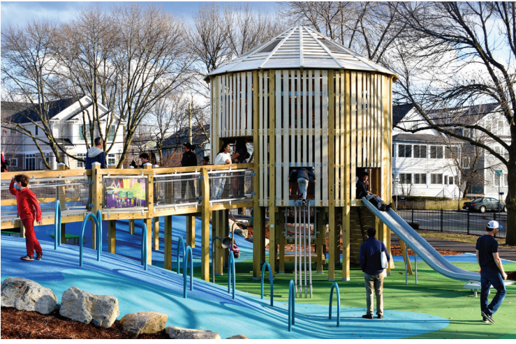
صورة بواسطة Daney Park في الجديد Louis A. DePasquale Universal Design Playground .Cambridge Arts

ومن المتوقع إنشاء Triangle Park الجديدة في East Cambridge ليتم الانتهاء منها في السنة المالية ٢٣. وستستمر أعمال التجديد في Sennott Park في حي Port، وسيبدأ البناء في Binney Street Park الجديدة. ومن المتوقع أيضًا أن يبدأ التشييد في إدخال تحسينات على Peabody School Playground. وستبدأ العمليات المجتمعية لإعادة تصميم Hoyt Field في حي Highlands في Raymond Park وRiverside neighborhood وRafferty Park في حي Cambridge