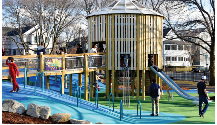
New Louis A. DePasquale Universal Design Playground nan Danehy Park.

Nan ane fiskal 22, Vil la te fini konstriksyon sou plizyè enpòtan pak ak pwojè espas ouvè. Timothy J. Toomey, Jr. Park nan East Cambridge prezante yon espas pou jwe, espas pou chen kouri, ak pak vèt. Louis A. DePasquale Universal Design Playground nan Danehy Park sèvi kòm yon modèl pou yon espas pou jwe enklizif ki fèt pou vizitè ki gen tout kapasite yo jwe ansanm. Renovasyon nan Glacken Field te gen ladan amelyorasyon nan zòn jaden an, yon chemen bouk perimèt, koneksyon amelyore ak tribinal ki egziste deja yo, ak yon teren totalman renouvle. Watertown-Cambridge Greenway bay yon nouvo koneksyon chemen ki gen plizyè itilizasyon ant Fresh Pond Reservation ak Watertown.