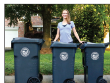
本市将于今年春季推出标准化垃圾车 第 6 页