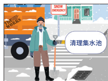
冬季天气建议与提示 第 4-5 页