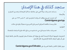
此问题的要点被翻译成多种语言。 第 9-15 页