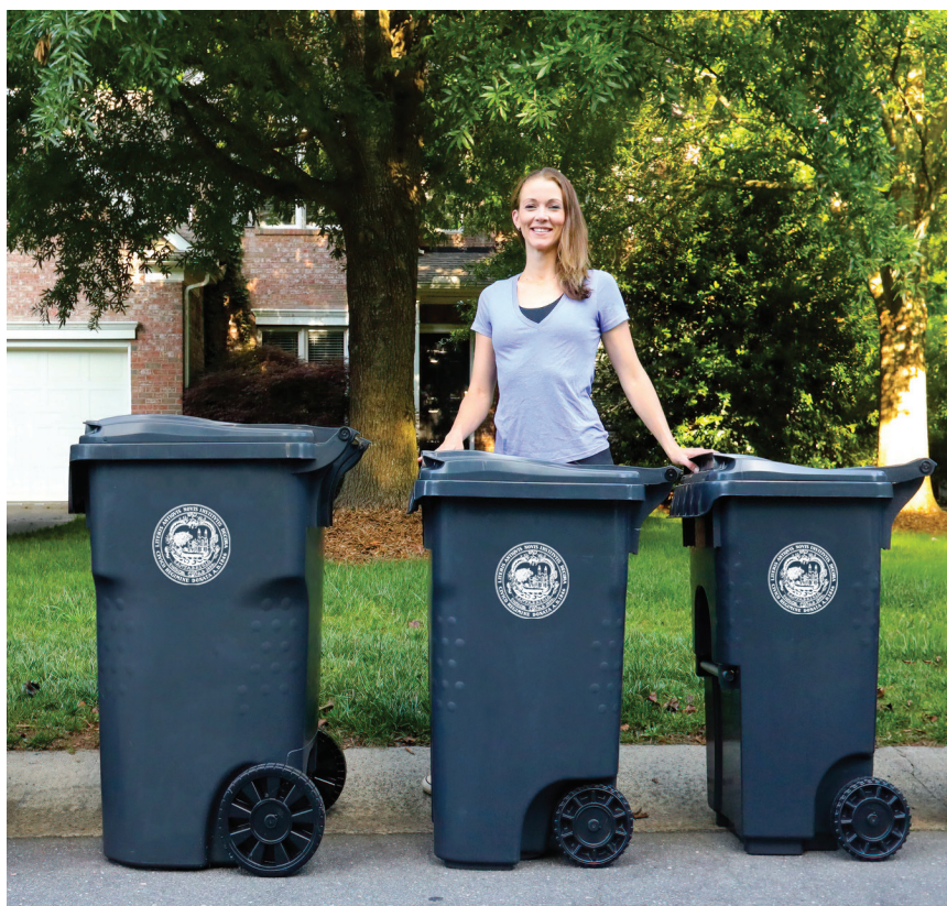
本市可能会为新计划选择的三种不同的垃圾车示例。

2022 年初，本市将举办一次关于新计划的社区会议。本市还将发送一张明信片，告知何时会有新的垃圾车，以及如何处理旧的垃圾桶。新的垃圾车将有三种不同的尺寸，以适应不同的大楼尺寸。注册本市的每月回收、堆肥和垃圾时事通讯，并随时了解该计划和本市其他垃圾计划，网址为 Cambridgema.gov/Subscribe 。