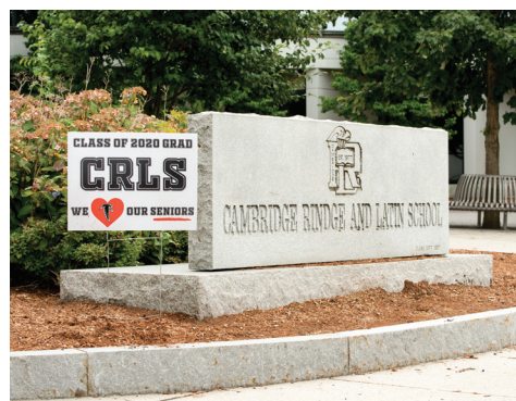
2021 年居民许可证照片由 Mark Hornbucke 拍摄。

目前的居民和游客许可证有效期至 2022 年 3 月 31 日。2022 年居民/游客停车许可证的更新季将为 2022 年 1 月 3 日至 3 月 31 日。虽然 2022 年 1 月 3 日之前不会发放或邮寄许可证，但居民可以自 2021 年 12 月 1 日星期三起在线更新。在线申请需要 3-5 周的处理时间。访问 Cambridgema.gov/RPP 了解更多信息。