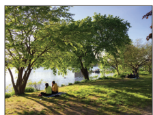
剑桥气候变化适应计划 第 3 页