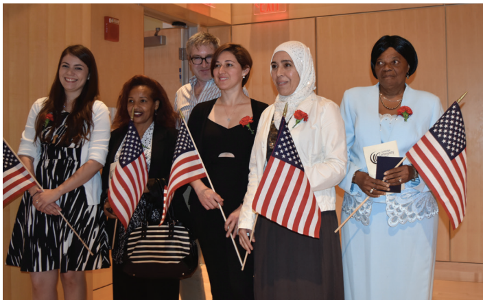
Foto gradyasyon Klas Sitwayènte a ki te pran avan pandemi COVID-19 la.

Mwen te santi m an sekirite la, epi pwofesè yo toujou la pou reponn kesyon w yo. CLC pa sèlman ede etidyan aprann Anglè oswa jwenn yon travay. Yo ede nou devlope mwayen pou nou viv."