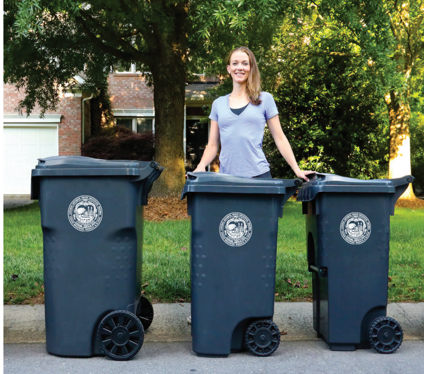
Yon egzanp twa charyo fatra diferan Vil la gendwa chwazi pou nouvo pwogram nan.

Nan kòmansman 2022 Vil la pral òganize yon reyinyon Kominotè sou nouvo pwogram nan. Vil la pral voye tou yon kat postal ak enfòmasyon sou kilè w ta dwe espere yon nouvo charyo fatra ak fason pou w debarase w de ansyen barik fatra yo. Nouvo charyo a ap vini nan twa gwosè diferan pou akomode bilding ki genyen gwosè diferan. Enskri nan Bilten Enfòmasyon masyèl Resiklaj, Konpostaj ak Fatra a pou rete enfòm nan pwogram sa a ak lòt pwogram fatra nan Vil la nan Cambridgema.gov/Subscribe .