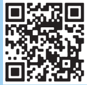
ለመመዘን የQR ኮድን ይቃኙ

Storm Stewards (የማዕበል አስተናጋጆች) የዝናብ ውሃን እንዴት ይረዳሉ? የፍሳሽ ማስወገጃ በመውሰድ፣ በጎ ፈቃደኞች በየወሩ የውሃ መውረጃውን ለመፈተሽ እና እንደ ቆሻሻ እና ቅጠሎች ካሉ ፍርስራሾች ለመጠበቅ ቃል ገብተዋል። ይህ የዝናብ ውሃ ወደ ፍሳሽ ማስወገጃው ውስጥ ሊፈስ እና እነዚህን ቁሳቁሶች ከውሃ መንገዶቻችን ለመጠበቅ ይረዳል።